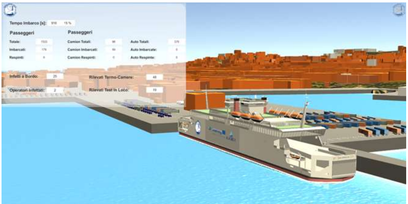
Fig.1: Scénario du simulateur dans le port de Cagliari

ALACRES2, Laboratoire de Crises et Urgences, a mené une série d'expérimentations axées sur la gestion des accidents significatifs liés aux phases de chargement et de déchargement de marchandises et substances dangereuses dans la zone portuaire. En utilisant des technologies avancées telles que la simulation, la réalité virtuelle (VR) et la réalité augmentée (AR) et en adoptant le paradigme MS2G, des scénarios ont été évalués, notamment ceux relatifs à la pandémie de COVID-19, afin d'affiner les procédures et protocoles d'urgence. ALACRES2 prévoyait de mener des analyses expérimentales pour vérifier et valider les modèles de simulation à l'aide de l'analyse de variance (ANOVA) et du plan d'expériences (DOE). Les Table Top Exercises à réaliser avec l'équipe championne d'ALACRES2 en utilisant le laboratoire de simulation virtuelle pour évaluer l'efficacité de l'outil ont également été définis. Enfin, compte tenu de la présence de la crise du covid-19 au cours du projet, des tests ont également été menés en référence à ces scénarios. Ce document rapporte les hypothèses et plages expérimentales établies ainsi que les résultats des expérimentations menées aussi bien pour l'ANOVA, le DOE que pour les exercices avec Champion Team.