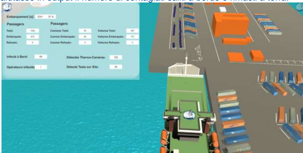
Fig.2: procedura di imbarco passeggeri con descrizione del monitoraggio COVID-19

Il simulatore analizza diverse combinazioni di metodi di screening per valutare quale combinazione è più efficace nel prevenire l'imbarco di individui contagiati e si valuta la quantità di persone contagiata che riesce a salire a bordo e la sua potenziale diffusione durante il viaggio. L'obiettivo del simulatore è quello di identificare il metodo o la combinazione di metodi più efficace per prevenire l'accesso a individui contagiati e minimizzare il rischio di diffusione del virus a bordo del traghetto. Per far questo è stato implementato nuovamente un Design of Experiment che tenesse in considerazione i metodi di screening implementati e valutasse in output il numero di contagiati saliti a bordo e rimasti a terra.