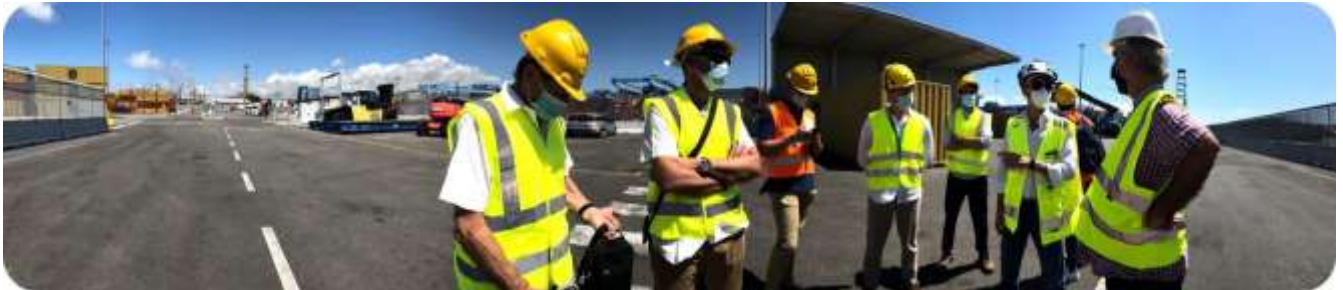
Fig.1 – Visite du port de Gênes pour évaluer les modèles ALACRES2 avec l'équipe Champion et d'autres experts opérationnels dans les ports, juin 2021

Au cours de ces réunions, des algorithmes, des modèles ont été analysés et des versions ultérieures du simulateur ont été utilisées, ainsi que les résultats expérimentaux ont été analysés. D'autres experts du monde portuaire et maritime ont également été invités à nombre de ces réunions, extérieurs à la Champion Team, mais en contact avec ses membres et présents dans le contexte où les réunions étaient organisées, ce qui a permis d'approfondir encore l'évaluation de l'équipe. Laboratoire Virtuel (fig.1 et 2). Dans certains cas, les résultats ont été générés dynamiquement ensemble au sein de l'équipe Champion et les indications des participants ont été recueillies, ce qui a mis en évidence la cohérence des modèles et l'extrême efficacité du laboratoire virtuel dans la représentation des scénarios choisis.