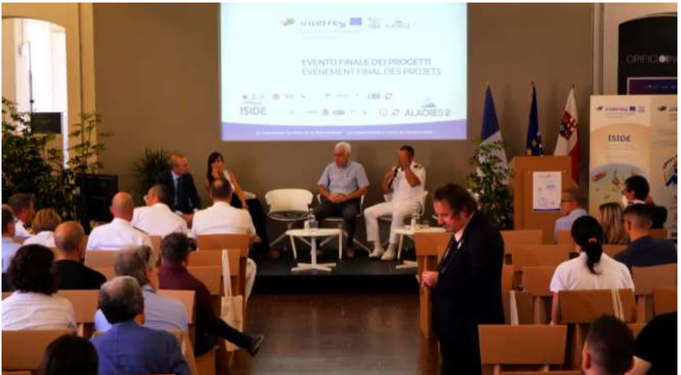
Fig.3 – Démonstration interactive Final du Laboratoire Virtuel à Cagliari 2022

Les démonstrations finales se sont achevées en septembre 2022 à Cagliari et Rome avec la participation de l'équipe championne devant un public d'experts, montrant de manière dynamique et interactive les capacités du laboratoire virtuel et les résultats sur les scénarios réalisés, souvent par des tests de la simulation directement aux participants et recueillir les commentaires (figure 3).