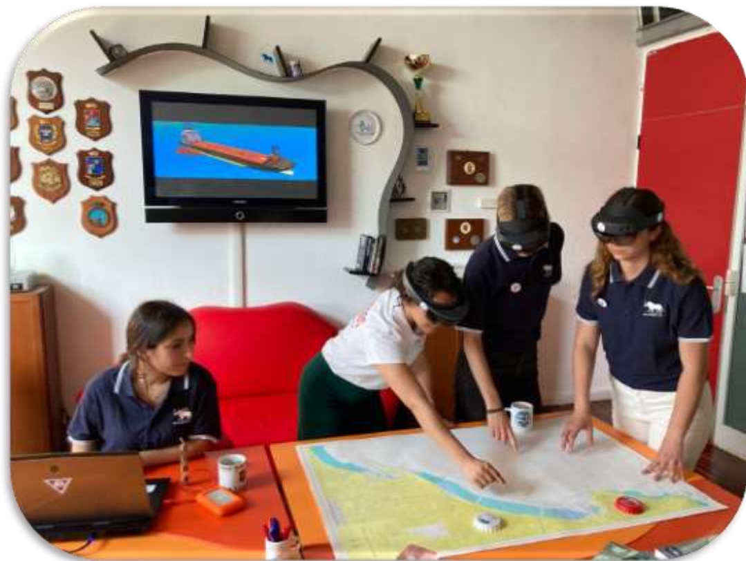
Fig.5 – Test condotto con giovani Ingegneri su ALACRES2

Si sono condotti test e dimostrazioni con giovani ingegneri non esperti del sistema di simulazione e del contesto portuale che hanno permesso al Champion Team di verificare la possibilità di formare risorse capaci molto rapidamente in modo da qualificare le persone giuste nel proprio staff per poter mantenere operativo il Laboratorio Virtuale e garantirne il funzionamento in Futuro. Infatti, giovani con una solida base digitale si sono dimostrati capaci agevolmente di installare e impiegare ALACRES2 nelle varie modalità d'impiego (figura 5).