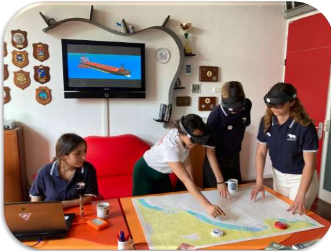
Fig.5 – Test réalisé auprès de jeunes ingénieurs sur ALACRES2