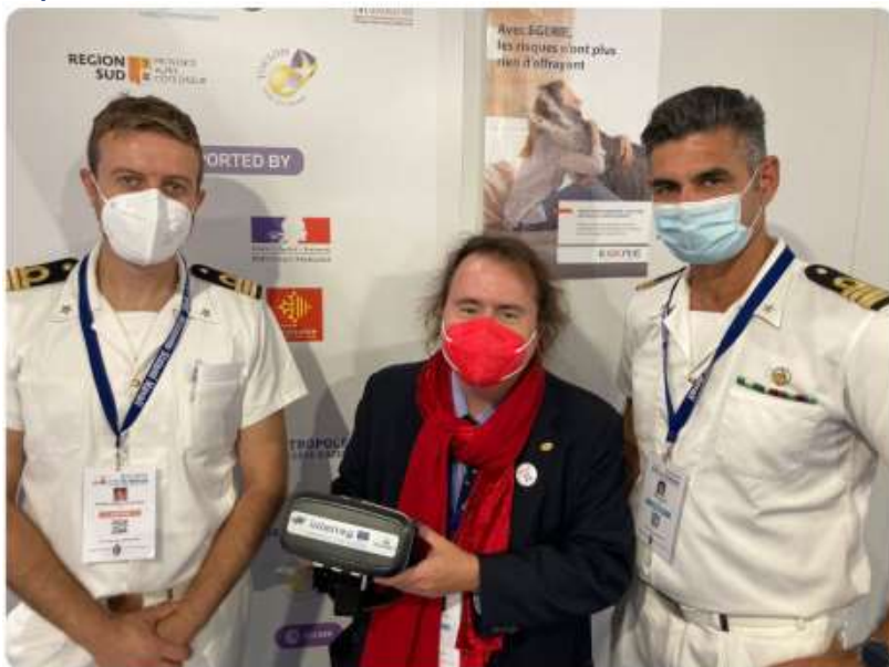
Fig.2 – Revue des modèles et de l'architecture à La Spezia et présentation monde virtuel lors du Sea Future 2021

Au cours de ces réunions, des algorithmes, des modèles ont été analysés et des versions ultérieures du simulateur ont été utilisées, ainsi que les résultats expérimentaux ont été analysés. D'autres experts du monde portuaire et maritime ont également été invités à nombre de ces réunions, extérieurs à la Champion Team, mais en contact avec ses membres et présents dans le contexte où les réunions étaient organisées, ce qui a permis d'approfondir encore l'évaluation de l'équipe. Laboratoire Virtuel (fig.1 et 2). Dans certains cas, les résultats ont été générés dynamiquement ensemble au sein de l'équipe Champion et les indications des participants ont été recueillies, ce qui a mis en évidence la cohérence des modèles et l'extrême efficacité du laboratoire virtuel dans la représentation des scénarios choisis.