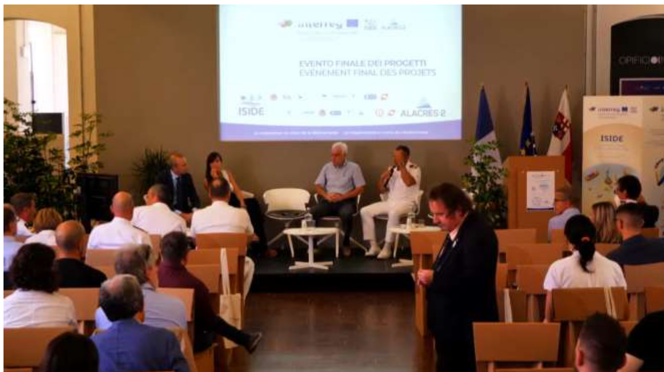
Fig.3 – Dimostrazione Interattiva a Roma del Laboratorio Virtuale durante I3M 2022

Le dimostrazioni finali sono state completate a settembre 2022 a Cagliari e Roma con coinvolgimento del Champion Team davanti ad un pubblico di esperti, mostrando dinamicamente e interattivamente le capacità del Laboratorio Virtuale e i Risultati sugli scenari condotti, spesso facendo provare direttamente la simulazione ai partecipanti e raccogliendo il feedback (figura 3).